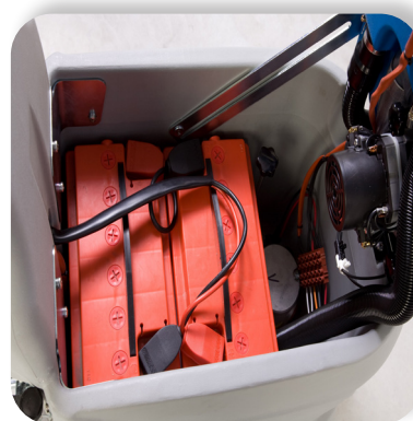
batterie al gel o acido con grande autonomia gel or acid batteries with great autonomy