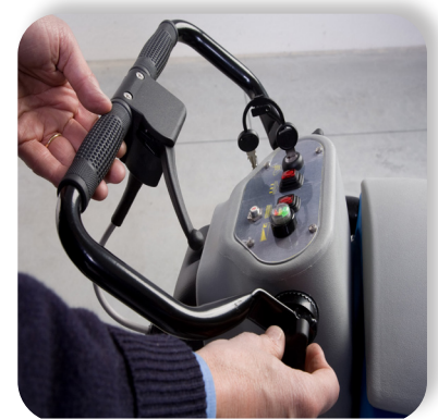
comandi semplici e intuitivi simple and intuitive controls