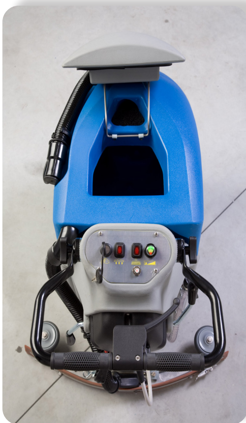
capacità serbatoio elevato high tank capacity