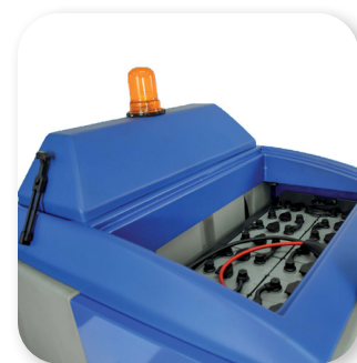
batterie con grande autonomia batteries with great autonomy