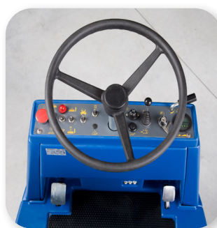
comandi semplici e intuitivi simple and intuitive controls