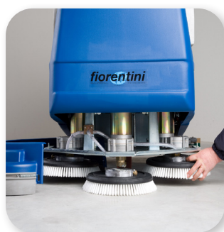
facile sostituzione delle spazzole easy brush replacement