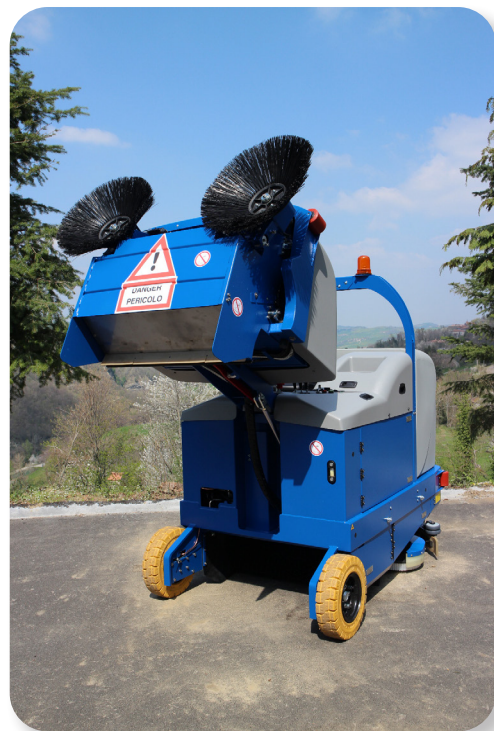
scarico elevato per semplificare il lavoro

very powerful and easily accessible suction motor