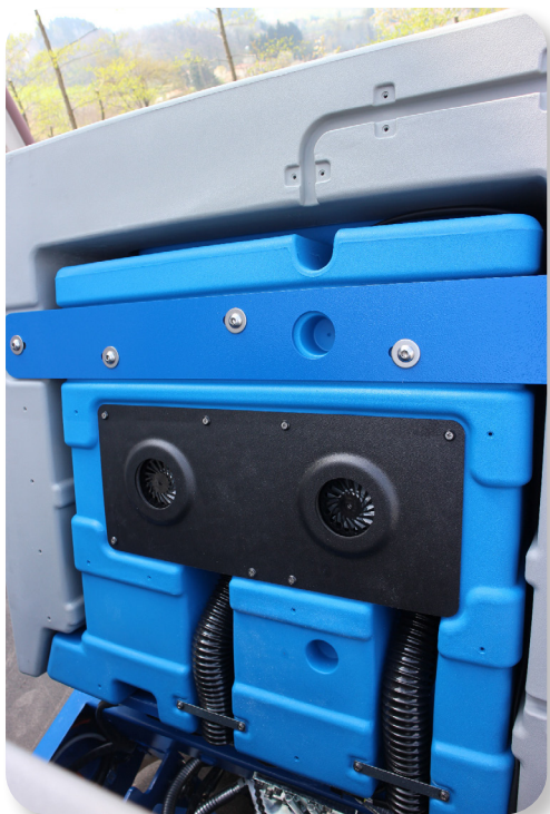
motore di aspirazione molto potente e facilmente accessibile

very powerful and easily accessible suction motor