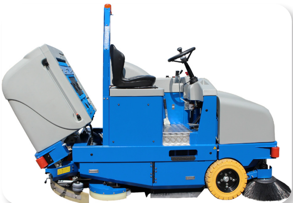
facile accesso per eventuale manutenzione