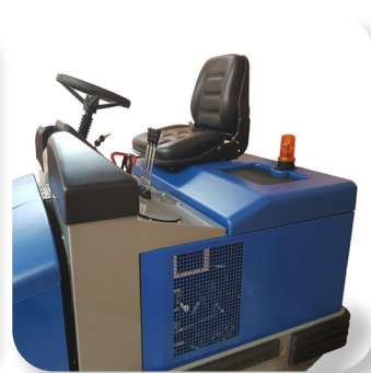
controlli semplici ed intuitivi user-friendly controls