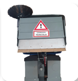
scarico alto per facilitare il lavoro dumping height