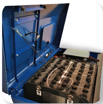
manutenzione molto facile easy maintenance