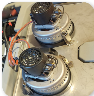
motore di aspirazione molto potente very powerful suction motor