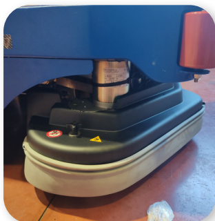
facile sostituzione delle spazzole easy brush replacement