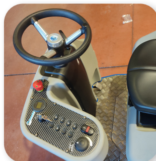
comandi semplici e intuitivi simple and intuitive controls